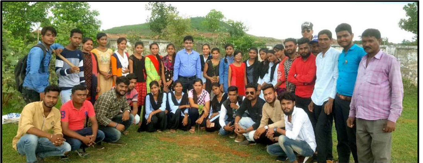
वृक्षारोपण कार्यक्रम : दिनांक 26 जुलाई 2019 शासकीय निरंजन केशरवानी महाविद्यालय कोटा, जिला-बिलासपुर (छ.ग.)