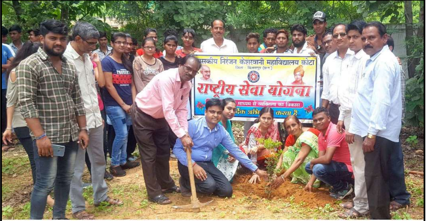
वृक्षारोपण कार्यक्रम : दिनांक 26 जुलाई 2019 शासकीय निरंजन केशरवानी महाविद्यालय कोटा, जिला-बिलासपुर (छ.ग.)